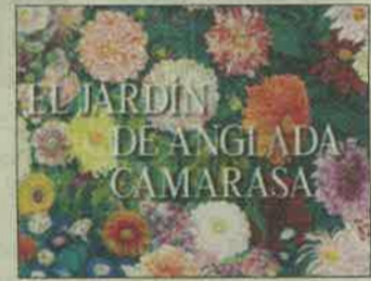
CaixaForum ● 'El Jardín de Anglada-Camarassa', el interés del pintor por las flores. Hasta 25 agosto.