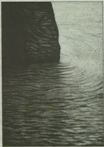
La muestra puede visitarse hasta el próximo 29 de abril.

La galería MA, desde el pasado 15 de marzo hasta el próximo