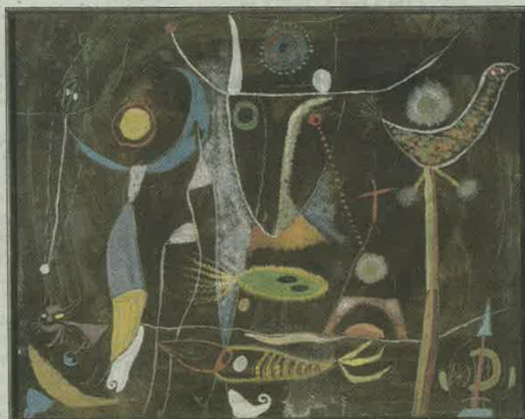
'Composició', una obra del artista catalán Modest Cuixart.

sos. Fue a mitad del siglo XX que un grupo de artistas empezaron a trabajar en el sentido de la van-