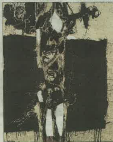
'Homúnculo', de Manolo Millares.

Finalizada la Segunda Guerra Mundial, se produjeron grandes cambios en todos los aspectos. Los países, que habían luchado unos contra otros, se convertían en aliados. Algunos de los países que no consiguieron crear alianzas con otros muchos estados fueron España, por el altísimo precio que Alemania pedía para un entendimiento, y Alemania, por lo mucho que pedía como contrapartida de lo que solicitaba Franco y por lo poco que ofrecía, teniendo en cuenta que Franco nunca fue del agrado de Hitler. Pero las evoluciones y cambios no fueron solo de tipo político, sino de aspectos diver-