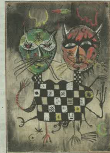
Una creación de Joan Ponç.

En Barcelona encontramos Dau al Set, con Antoni Tàpies, Joan-Josep Tharrats, Joan Ponç i