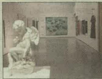
Es Baluard Museu ● 'En diálogo: Museo y Colección', recorrido por la colección del museo. Hasta el 26 de mayo.