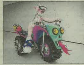
Es Baluard Museu ● 'Tractor Buddy', de Bel Fullana, muestra una escultura cuki-terrorista. Hasta el 9 de junio.